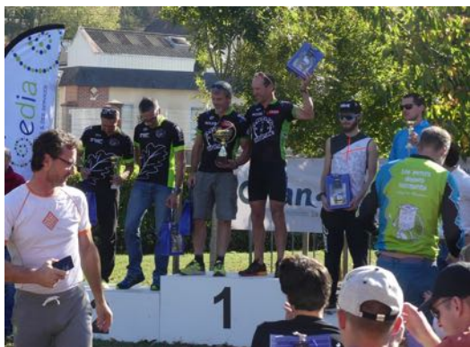
Le podium de l'épreuve sur 100 km.