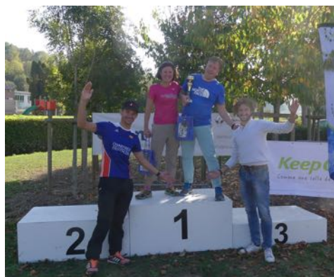
... et sur 50 km.

Soutenus par de nombreux partenaires privés et publics et par la structure mère du Club Omnisports de Vernouillet, l'ensemble des membres du Club Natation Water-Polo Triathlon étaient unis dans un même élan et avec la même énergie pour faire de l'événement un vrai moment de plaisir partagé ! Pari réussi ! Tous les résultats sont consultables en ligne sur https://protiming.fr/Results/running/4423/2962 Toutes les photos sont consultables sur la page Facebook de l'évènement :