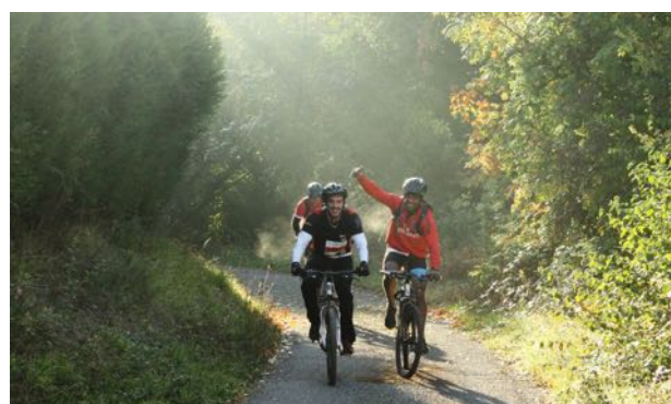
L'épreuve de VTT

Au terme de la course, des participants qui sont allés au bout d'eux-mêmes et qui soulignent d'une même voix la beauté des paysages traversés et le formidable "terrain de jeu" qu'offre notre territoire. Au-delà de l'événement sportif c'est aussi une véritable aventure humaine qu'ont partagé l'ensemble des organisateurs et bénévoles aux côtés des sportifs.