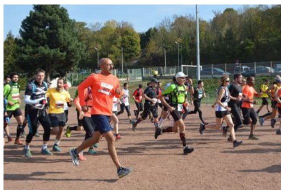
Le départ de la course

Ils étaient plus de cinquante participants venus de toute la France, à prendre le départ du Raid Chanoine, ce samedi après-midi, sous un magnifique soleil. Parmi les épreuves, Trail, VTT, tir laser sur cible, course d'orientation de nuit, cross natation (sorte de parcours du combattant dans l'eau) ... au total, 100 kilomètres de distance cumulée pour l'épreuve reine "The RAID Chanoine", réparties sur 12 communes de l'agglomération de Dreux.